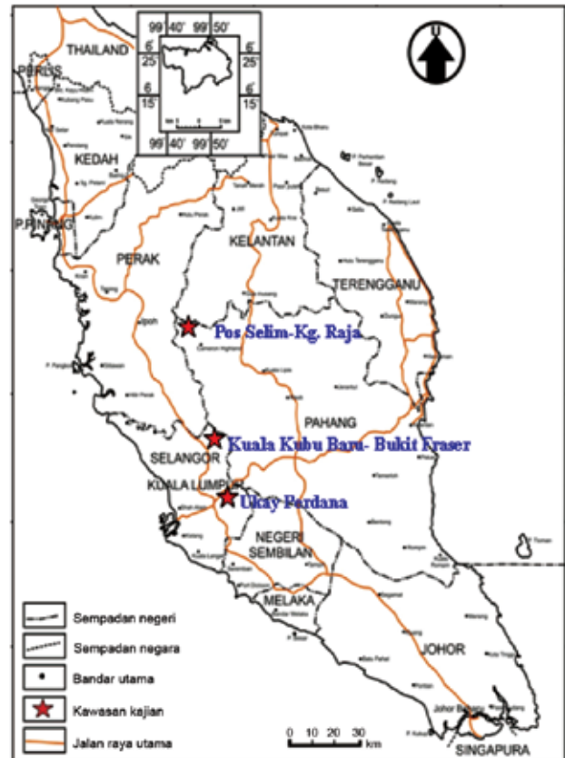
RAJAH 1. Lokasi kawasan kajian

Jalan Pos Selim-Kg Raja (km18-19, 21-24, 25-26) Batuan metamorf kawasan kajian berusia Ordovisi – Silur dan berasal daripada sedimen klastik seperti syal dan batu pasir